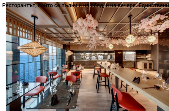
Ресторантът, който се пълни и на обяд, и на вечеря. Единственият,

за който ви препоръчваме да си направите резервации колкото може по-рано. Работи за обяд и за вечеря и предлага специалитети от цялата азиатска кухня - Япония, Китай, Тайланд, Филипините, Индонезия и Корея.