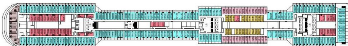
Палуба 10 Giunone