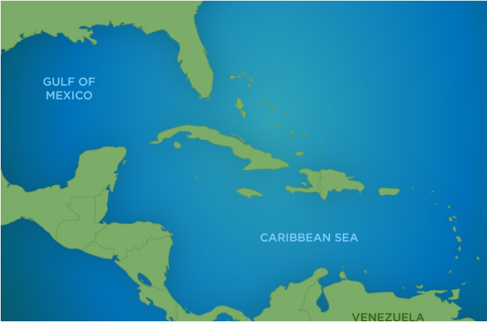
Картата е само за обща ориентация. Координатите са приблизителни и не целят да покажат точната локация на кораба.

КРУИЗНА КОМПАНИЯ: CELEBRITY КОРАБ: CELEBRITY CONSTELLATION ⚓⚓⚓⚓⚓