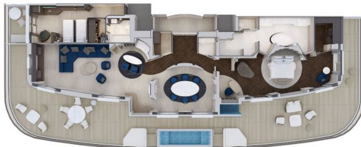
Схема на Owner's Residence при свързване с Ocean Terrace Suite: