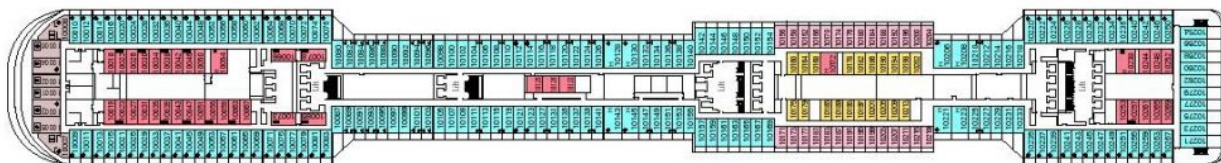
Палуба 10 Giunone