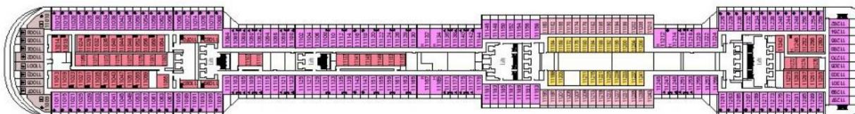
Палуба 11 Iride

Средна палуба, на която са разположени пътнически каюти от следните категории: