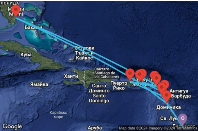
Картата е само за обща ориентация. Координатите са приблизителни и не целят да покажат точната локация на кораба.

Легенда: "А" - начална точка; "В" - крайна точка; "О" - начална и крайна точка