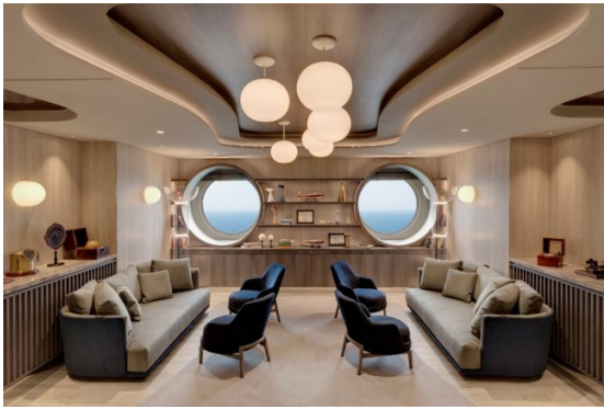
Marble & Co. Grill