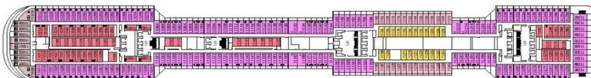
Палуба 11 Iride

Средна палуба, на която са разположени пътнически каюти от следните категории: