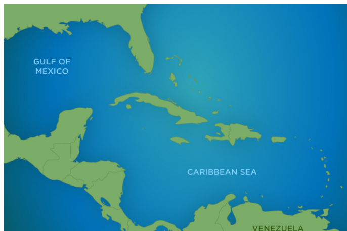
Картата е само за обща ориентация. Координатите са приблизителни и не цялят да покажат точната локация на кораба.