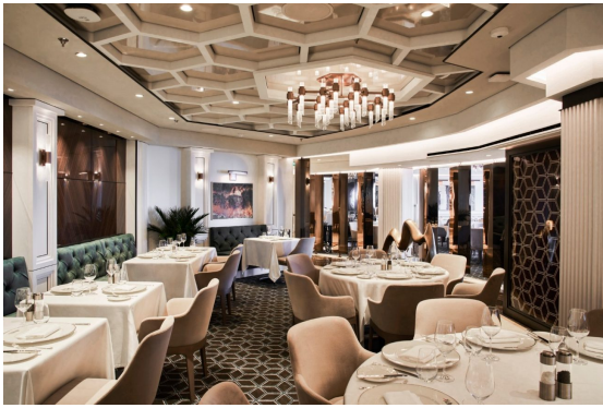
Med Yacht Club