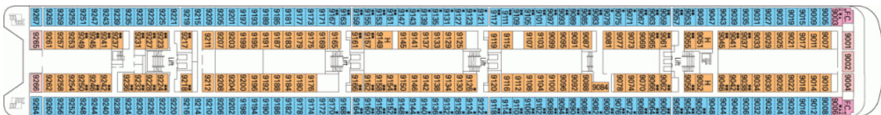
Палуба 10 - Tormalina