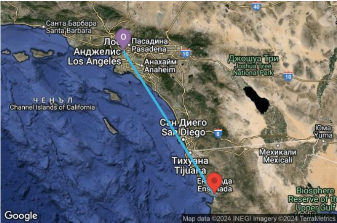
Картата е само за обща ориентация. Координатите са приблизителни и не целят да покажат точната локация на кораба.

Легенда: "А" - начална точка; "В" - крайна точка; "О" - начална и крайна точка