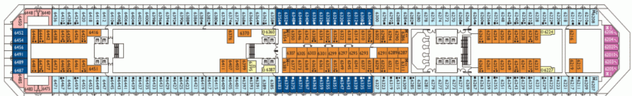
Палуба 7 - Bobou