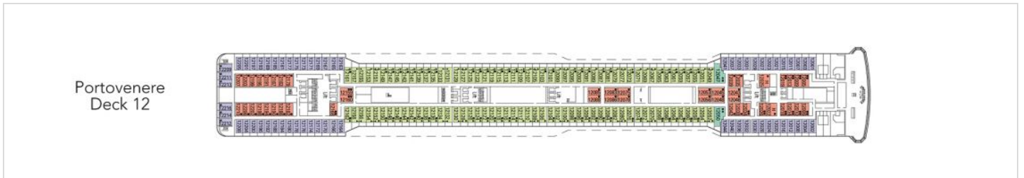
Палуба 12 - Portovenere