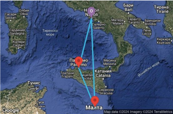
Картата е само за обща ориентация. Координатите са приблизителни и не целят да покажат точната локация на кораба.

Легенда: "А" - начална точка; "В" - крайна точка; "О" - начална и крайна точка