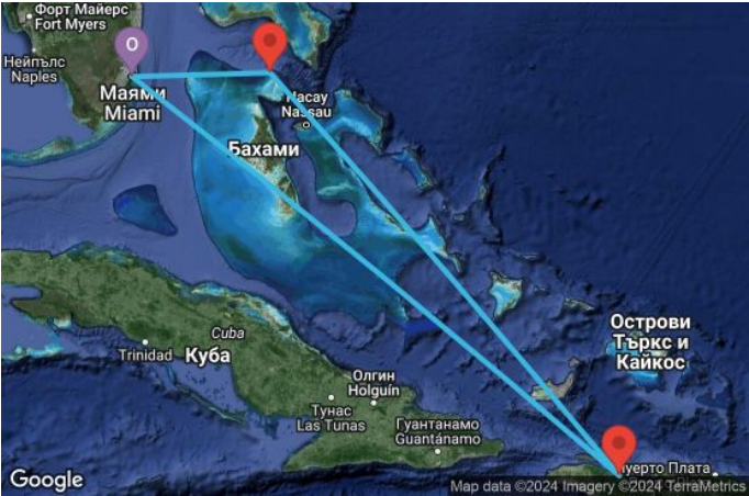
Картата е само за обща ориентация. Координатите са приблизителни и не целят да покажат точната локация на кораба.

Легенда: "А" - начална точка; "В" - крайна точка; "О" - начална и крайна точка