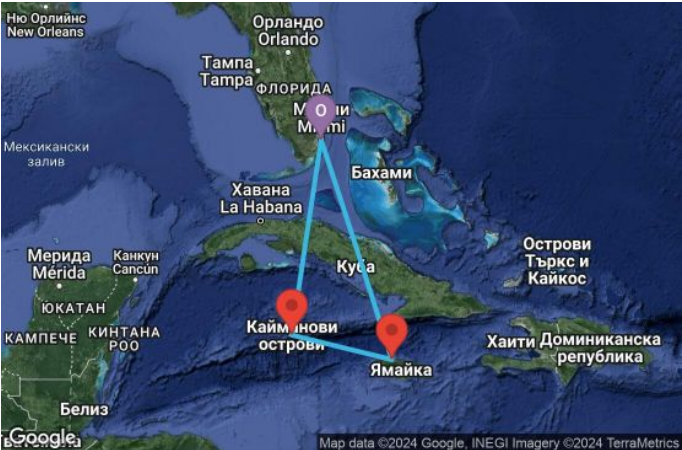
Картата е само за обща ориентация. Координатите са приблизителни и не целят да покажат точната локация на кораба.

Легенда: "А" - начална точка; "В" - крайна точка; "О" - начална и крайна точка