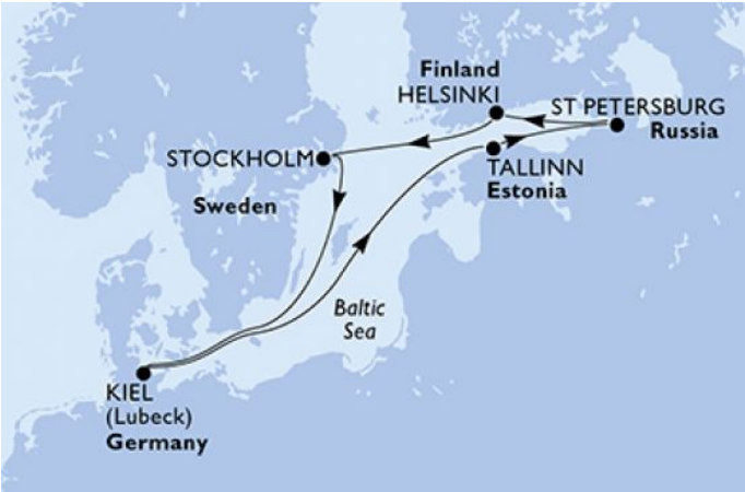
Картата е само за обща ориентация. Координатите са приблизителни и не целят да покажат точната локация на кораба.