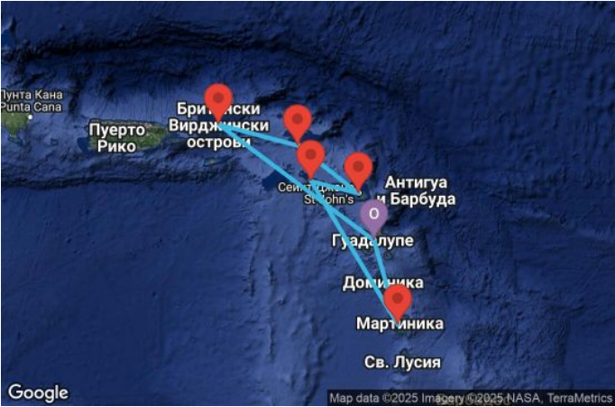
Картата е само за обща ориентация. Координатите са приблизителни и не целят да покажат точната локация на кораба.

Легенда: "А" - начална точка; "В" - крайна точка; "О" - начална и крайна точка