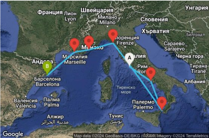
Картата е само за обща ориентация. Координатите са приблизителни и не целят да покажат точната локация на кораба.

Легенда: "А" - начална точка; "В" - крайна точка; "О" - начална и крайна точка