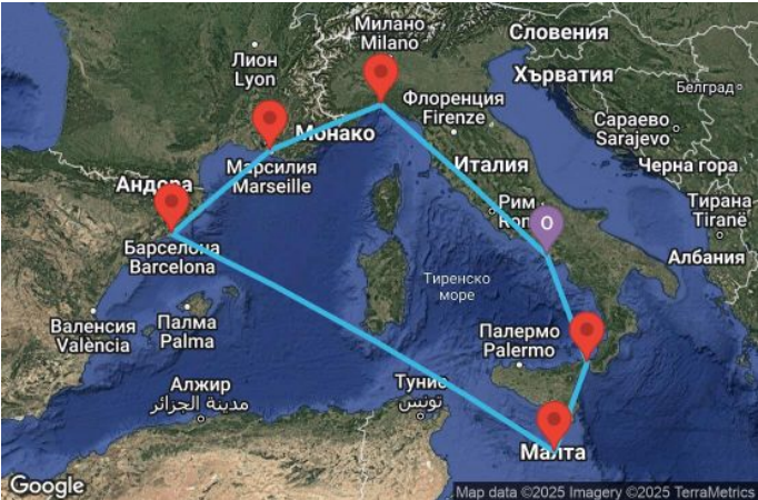
Картата е само за обща ориентация. Координатите са приблизителни и не целят да покажат точната локация на кораба.

Легенда: "А" - начална точка; "В" - крайна точка; "О" - начална и крайна точка