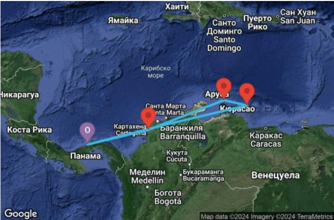
Картата е само за обща ориентация. Координатите са приблизителни и не целят да покажат точната локация на кораба.

Легенда: "А" - начална точка; "В" - крайна точка; "О" - начална и крайна точка