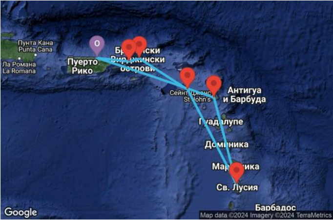
Картата е само за обща ориентация. Координатите са приблизителни и не целят да покажат точната локация на кораба.

Легенда: "А" - начална точка; "В" - крайна точка; "О" - начална и крайна точка