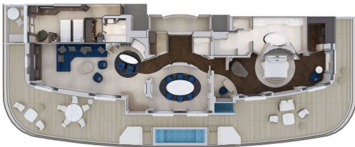
Схема на Owner's Residence при свързване с Ocean Terrace Suite: