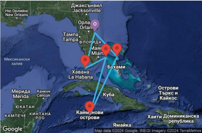
Картата е само за обща ориентация. Координатите са приблизителни и не целят да покажат точната локация на кораба.

Легенда: "А" - начална точка; "В" - крайна точка; "О" - начална и крайна точка