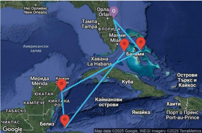
Картата е само за обща ориентация. Координатите са приблизителни и не целят да покажат точната локация на кораба.

Легенда: "А" - начална точка; "В" - крайна точка; "О" - начална и крайна точка