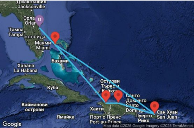
Картата е само за обща ориентация. Координатите са приблизителни и не целят да покажат точната локация на кораба.

Легенда: "А" - начална точка; "В" - крайна точка; "О" - начална и крайна точка