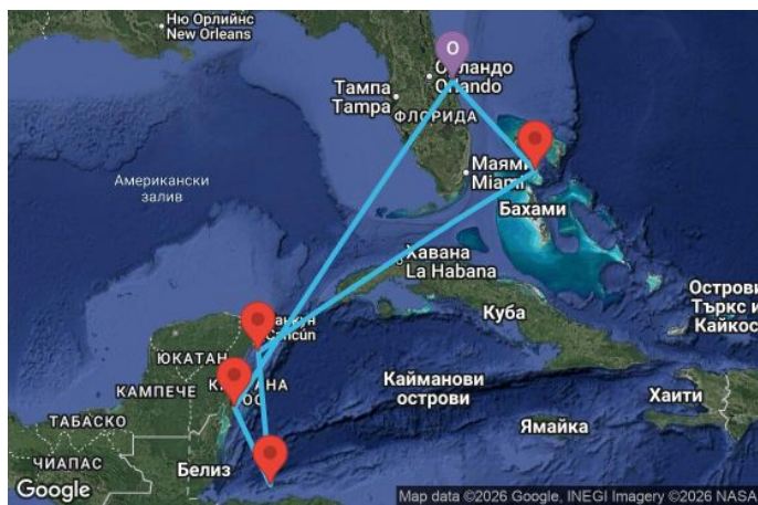
Картата е само за обща ориентация. Координатите са приблизителни и не целят да покажат точната локация на кораба.

Легенда: "А" - начална точка; "В" - крайна точка; "О" - начална и крайна точка