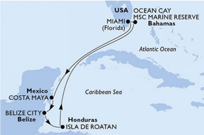
Картата е само за обща ориентация. Координатите са приблизителни и не целят да покажат точната локация на кораба.