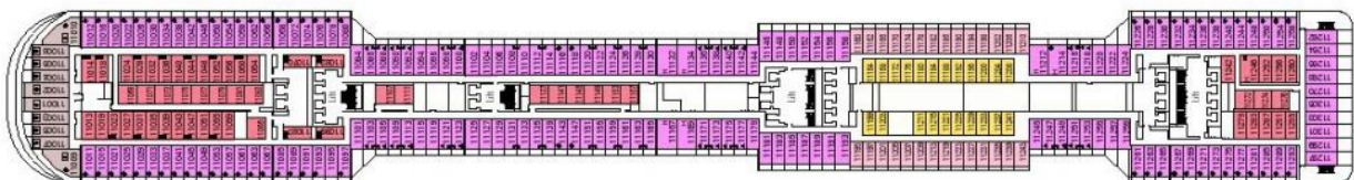
Палуба 11 Iride

Средна палуба, на която са разположени пътнически каюти от следните категории: