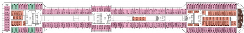
INCANTO Deck 12

На палуба 12 са разположени вътрешни каюти клас Fantastica, каюти с балкон клас Fantastica и Aurea, апартаменти клас Aurea и семейни апартаменти клас Executive.