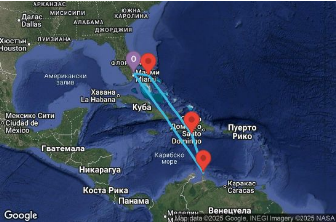
Картата е само за обща ориентация. Координатите са приблизителни и не целят да покажат точната локация на кораба.

Легенда: "А" - начална точка; "В" - крайна точка; "О" - начална и крайна точка