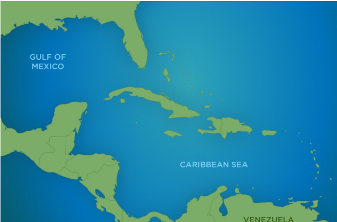
Картата е само за обща ориентация. Координатите са приблизителни и не целят да покажат точната локация на кораба.

КРУИЗНА КОМПАНИЯ: ROYAL CARIBBEAN КОРАБ: JEWEL OF THE SEAS ⚓⚓⚓⚓⚓