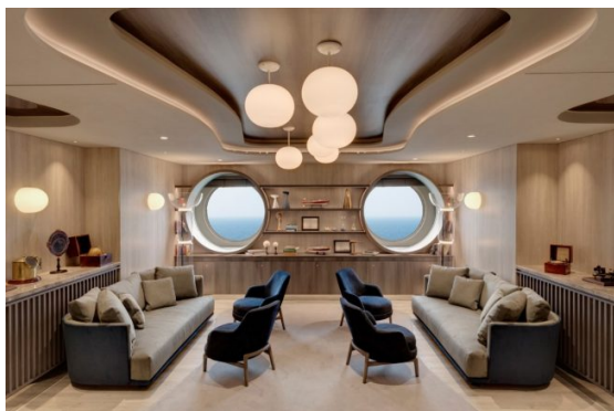
Med Yacht Club

Ако обичате Средиземноморска кухня, паста, морски дарове и южняшки бели вина - това е вашето място. Цялостната атмосфера и обзавеждане е в духа на Южна Европа. Само с предварителна резервация през приложението или по телефона.