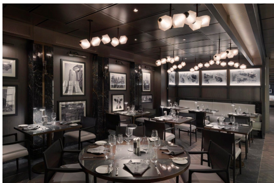
Marble & Co. Grill

Обичате хубави стекове? Вероятно още повече обичате безплатни и невероятно вкусни стекове. Сега добавете и огромен избор от висококачествени червени вина от Франция, Италия, Нова Зеландия, Испания или Чили и можем да се обзаложим, че ще сте тук през вечер. Не забравяйте да резервирате. А, да - лесно може да се увлечете и да прекалите с хлебчетата, които ви сервират, докато си чакате стека. Оставете си място, понеже имат и десерти.