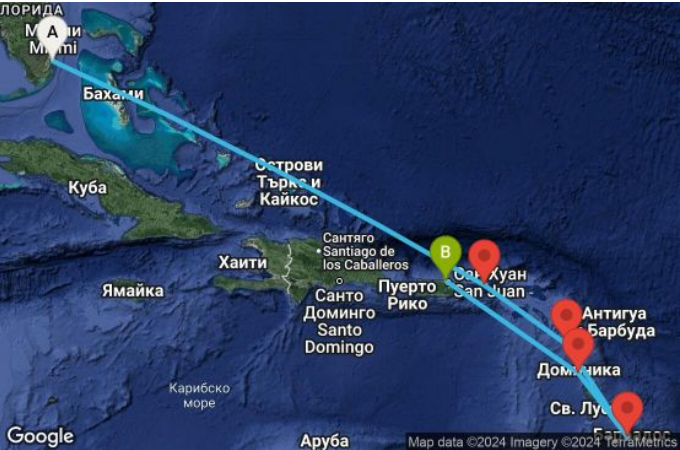
Картата е само за обща ориентация. Координатите са приблизителни и не целят да покажат точната локация на кораба.

Легенда: "А" - начална точка; "В" - крайна точка; "О" - начална и крайна точка